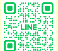
▲宮崎県大阪事務所 LINE