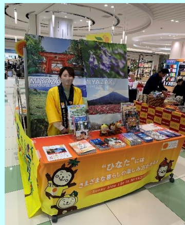
▲10種類以上の観光パンフレットから、目的に合ったものをご紹介します。