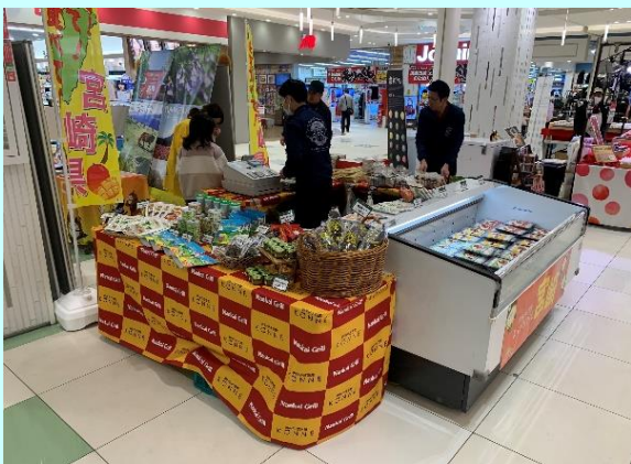
▲宮崎餃子やチーズまんじゅうは大人気！