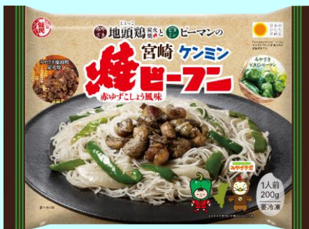
◀赤ゆずこしょう風味が美味しい

SNSフォロープレゼントキャンペーンでは、ご家庭で宮崎ケンミン焼ビーフンが作れる「みやざき地頭鶏加工品の詰め合わせセット（レシピ付き）」を30名様に準備したところ、8,500件以上の多数の応募があり、SNSを活用した宣伝効果の高いPRが実施できました！（川野）