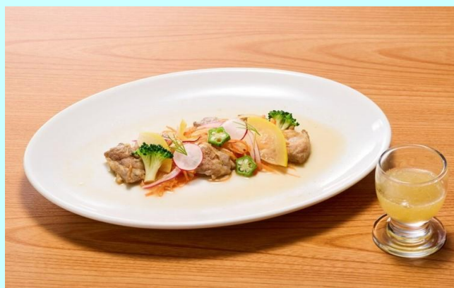
▲1位作品 ポークエスカベッシュ