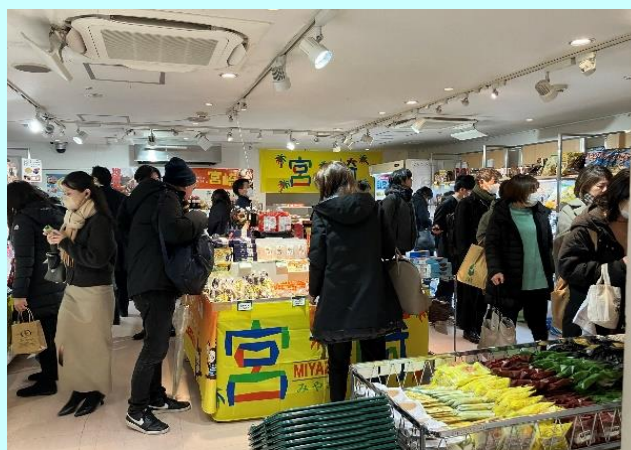
▲関西初登場の新品も数多く販売！