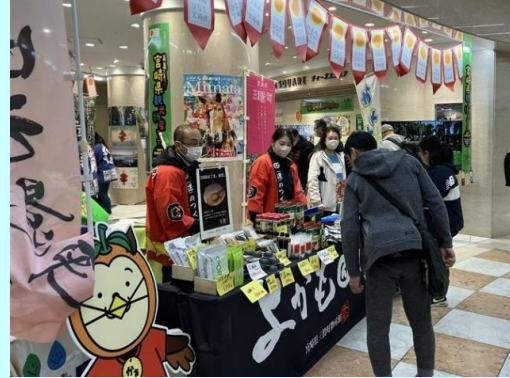
▲「宝石らっきょう」や「あくまき」を販売（三股町）