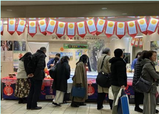
▲新商品の高千穂牛コロッケやハンバーグに興味津々（高千穂町）

このフェアには、堺みやざき館KONNE、高千穂町（鬼八の蔵）、日之影町（村おこし総合産業）、三股町（みたもんや）が参加し、鶏の炭火焼などの定番商品から高千穂牛を使った新商品や旬フルーツ完熟きんかん「たまたま」、宮崎の郷土お菓子「あくまき」などを販売。完売する商品が続出し、県産品のPRにつながりました。（湯地）