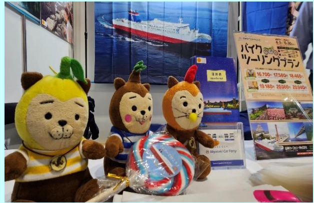
▲宮崎カーフェリーの絵が乗った大きな飴は子ども達へプレゼント