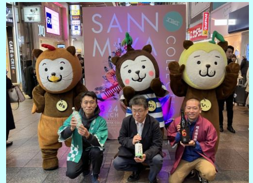
▲お湯割りなど好みの飲み方で試飲ができ大盛況でした。