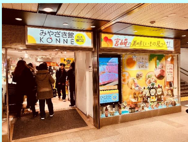
▲阪急大阪梅田駅で期間限定で開催

阪急大阪梅田駅は、1日の乗降客数40万人を誇る関西有数のターミナル駅であり、ポップアップストアには、連日多くのお客様に来店いただき、関西圏の消費者に本県の物産等の認知度を高めることができました。（野田）