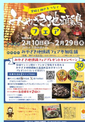
◀2月10日のみやざき地頭鶏（じとっこ）の日から開催

宮崎県大阪事務所では、公式Facebook、LINEのページを開設し、事務所の取組など、随時情報を更新しています！是非、ご登録をよろしくお願い致します。