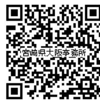
▲宮崎県大阪事務所 Facebook