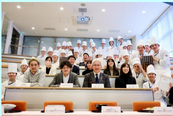
▲学生・審査員の集合写真

どのメニューも連日完売となり、期間中累計800食を売り上げる大好評のフェアとなりました！（田原）