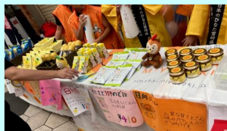
▲日向夏の商品を大きな声で販売しました