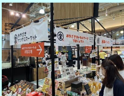
▲15店舗以上のお店が出展