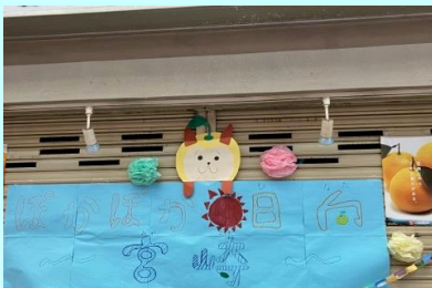
▲お手数の看板『はかばか日向~宮崎~』

「日向夏は冬にできる果物」「宮崎は日向(ひなた)と呼ばれていた」など子供達に宮崎のことを知ってもらえる機会になりました。(湯地)