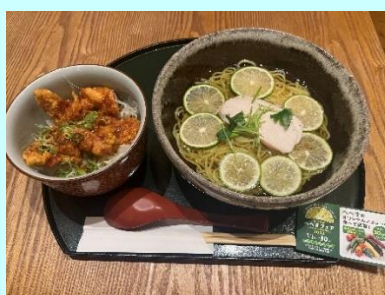
▲オリジナルメニュー