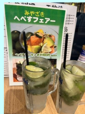
▲オリジナルメニュー