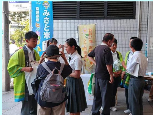
▲美郷のお米と干し椎茸をプレゼント