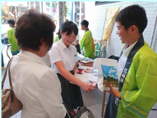
▲生徒お手製の資料で美郷町をPR

聞いてくださった方と一緒に笑顔になる姿も見られ、とてもいい経験になったのではないかなと思います。美郷南学園のみなさん、お疲れ様でした！（宮之原）