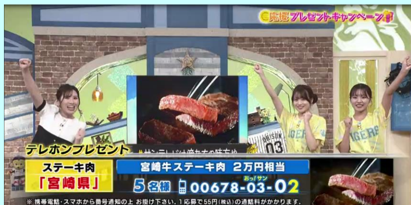
▲生CMで「おいしさ日本一宮崎牛」をPR!

熱い阪神戦が繰り広げられる中での生CMということで、宣伝効果の高い「おいしさ日本一宮崎牛」のPRができました。(川野)