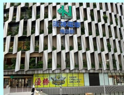
▲優勝セールに突入