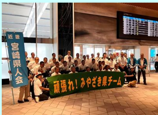
▲伊丹空港でお出迎えをした時の様子