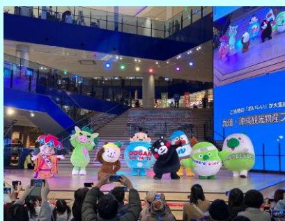
▲ご当地キャラステージ