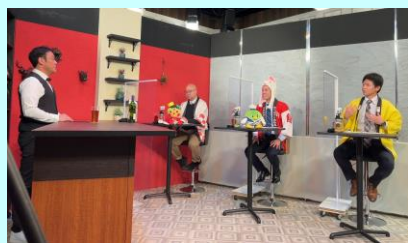
▲出演者(正面左から 栃木県、鳥取県、宮崎県)