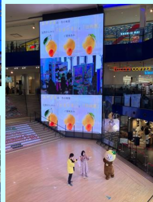
▲宮崎県観光PRステージ