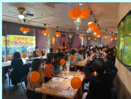
◀たまシャンで 乾杯

京阪神エルマガジン⇒ https://www.lmaga.jp/news/2023/01/587906/