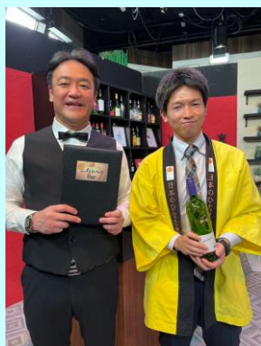
▲たむらさんと2ショット