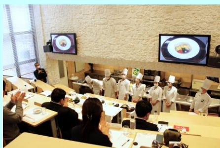
◀学生による プレゼン発表

https://www.pref.miyazaki.lg.jp/osaka/index.html