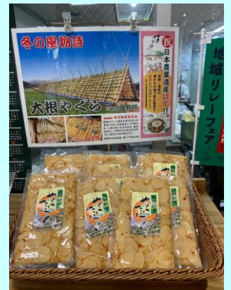
▲田野町商品「やぐらだいこん」