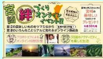
■絆づくりイベント

参加者は事前に届いた宮崎の地ビールやジュース、地鶏の炭火焼き等をつまみながら司会者の「乾杯～」のかけ声で、イベントがスタート。宮崎、大阪、そして全国の参加者の皆さんと宮崎のライフやアクティビティについて語り合い、宮崎愛でお腹いっぱい（笑）。