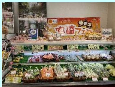
■宮崎の新鮮な野菜がずらり！