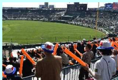
■スティックバルーンで応援！

3月20日、第93回選抜高校野球大会2日目の第1試合に宮崎県代表の宮崎商業高校が登場しました。宮崎県勢としては2年ぶり、宮崎商業としては52年ぶり3回目のセンバツ出場となりました。