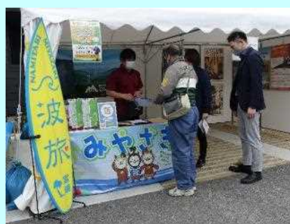
■宮崎についてPRしています！