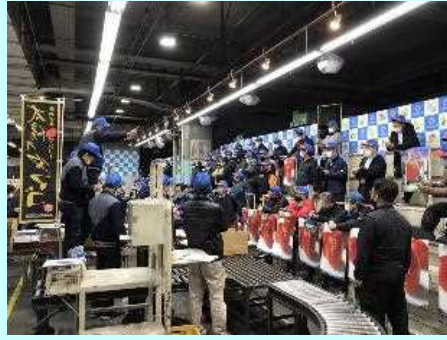
■大阪市中央卸売市場の初セリ

4月15日、宮崎県産完熟マンゴーブランド「太陽のタマゴ」が出荷解禁となりました。