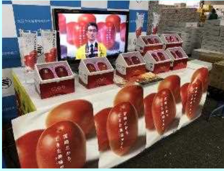
■今年も美味しい太陽のタマゴが揃いました！