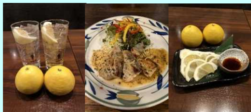
■かつ家(日向夏サワー、宮崎チョウザメステーキ、日向夏刺身)