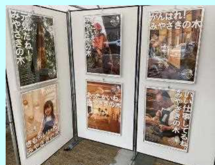
■宮崎県産木材の魅力を伝えます！