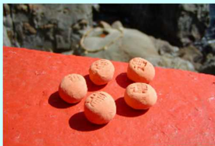
■休日には鶴戸神宮で運玉投げ

旅先で仕事をする「ワーケーション」。最近では、よく耳にするようになりました。宮崎といえば、自然あふれる中にたたく歴史的風景、太陽の恵みと豊潤な大地で育まれてきた食文化、魅力いっぱいのスポットが点在し、ワーケーションには最適なところですよ。