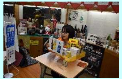
■大阪事務所から宮崎県の特産品紹介

観光、食、移住について触れることができ、宮崎をより身近に感じることができた2時間になりました。（上大迫）