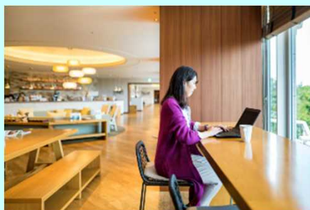
■いつもと違う環境で仕事してみませんか？