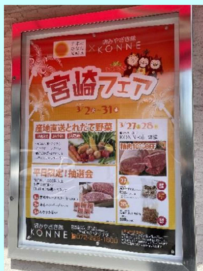
■宮崎フェアポスター

今回は、産地（JA都城、JAこばやし、JA尾鈴）直送のとれたて野菜や果物の販売をはじめ、店内でお買い物をされたお客様を対象に宮崎牛などが当たる抽選会（平日のみ）を行い、多くのお客様が旬の宮崎の食材を見て・買って・食べて楽しまれていました。（松葉）