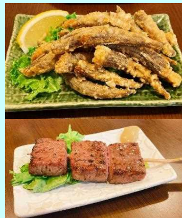
■宮崎地鶏みやかん (メヒカリの唐揚げ、宮崎牛串焼き)

フェアは好評のうちに終了し、店舗からは継続した食材利用の希望もありました。今後も、ゆかりのお店と協力して宮崎の食材をPRしていきます。（中村）