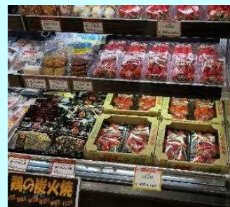
■いちごや鶏の炭火焼も人気でした！