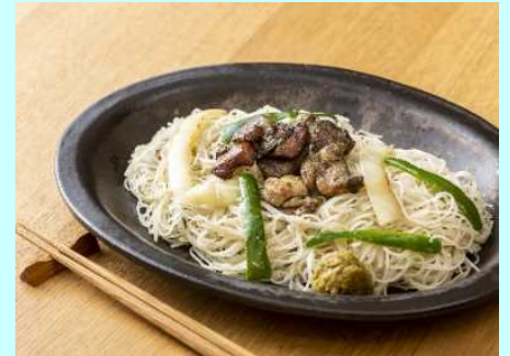
■食事にもおつまみにもピッタリ！

宮崎県内を中心とした販売においては、開始約1週間で完売するほど大好評で、消費者、バイヤー等からの要望もあり、早期に再販売が決定しました。