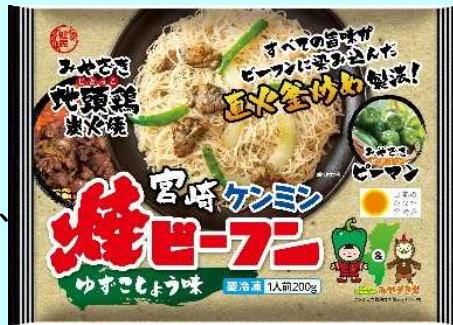
■商品パッケージはこちら

本商品は、「みやざき地頭鶏炭火焼」と「みやざきビタミンピーマン」、県産の青柚子胡椒を使用しており、みやざき地頭鶏の日（令和3年2月10日）に数量限定で販売されたものです。