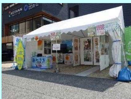
■宮崎県PR特設ブース

県内各地の観光地のポスター展示や映像の他、宮崎県に関するアンケート、クイズも実施し、正解したお客様には宮崎県産しいたけや木製品などの特産品をプレゼントするなど、宮崎の魅力をPRできました。（松葉）