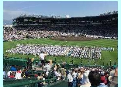
■夏の甲子園第100回開会式