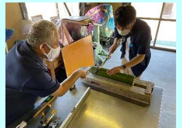
■かつほ鶏づくり体験

生活様式が変わりつつある今、リモート会議は当たり前の風景になりましたが、これからさらなる県内でのワーケーションの受入れに力を入れていかなければと強く感じました。(芥田)