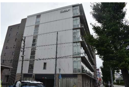
▲株式会社ニッショウ