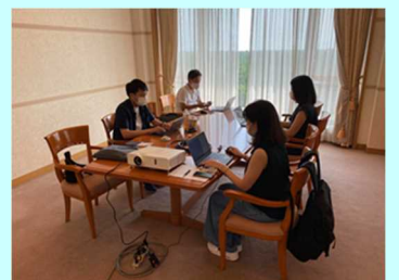
■ホテルでのワークショップ