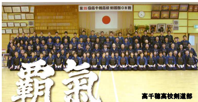
高千穂高校剣道部