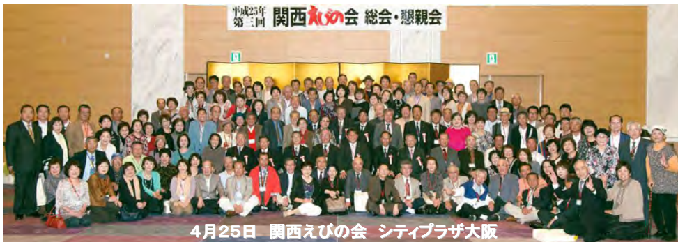
平成25年 第3回 関西えびの会 総会・懇親会 4月25日 関西えびの会 シティプラザ大阪