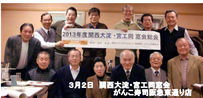
2013年度関西大淀・宮工同窓会総会 3月2日 関西大淀・宮工同窓会 がんこ寿司阪急東通り店