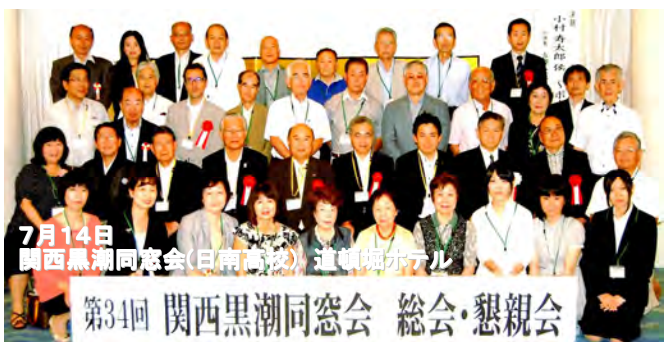
7月14日 関西黒潮同窓会(日南高校) 道頓堀ホテル 第34回 関西黒潮同窓会 総会・懇親会