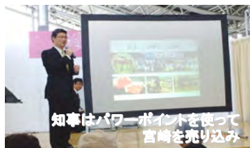
知事はパワーポイントを使って宮崎を売り込み