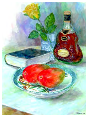
宮崎マンゴー(水彩8号)