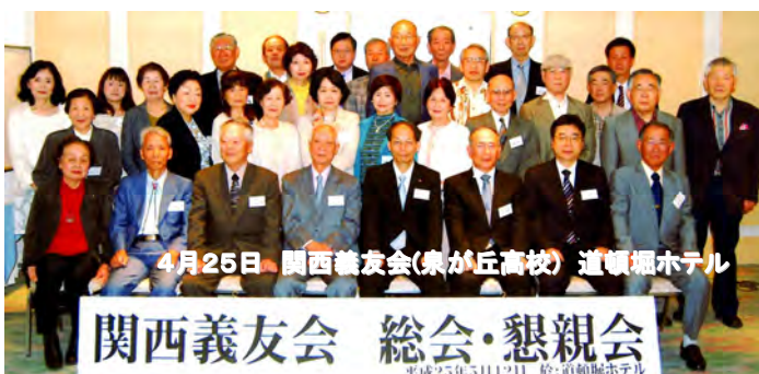
4月25日 関西義友会(梟が丘高校) 道頓堀ホテル 関西義友会 総会・懇親会 平成25年5月11日 於:道頓堀ホテル