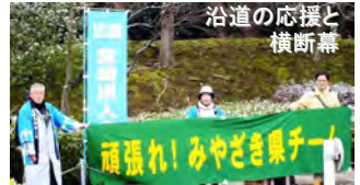
沿道の応援と横断幕

第24回全国車いす駅伝競走大会は平成25年2月17日、国立京都国際会議場前～西京極陸上競技場間の5区間21.3kmのコースで、全国から28チームが参加して行われました。レースは昨年優勝の福岡県チームが4区間で区間賞をとる圧倒的な強さで連覇(タイム45分31秒)しました。2位は大分、3位は京都でした。