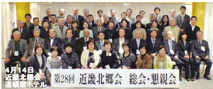
4月14日 近畿北郷会 道頓堀ホテル 第28回 近畿北郷会 総会・懇親会