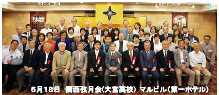
5月18日 関西弦月会(大宮高校) マルビル(第一ホテル)