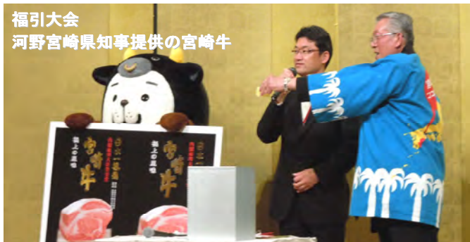
福引大会 河野宮崎県知事提供の宮崎牛