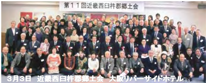
第1回 近畿西白杵郡郷土会 3月3日 近畿西白杵郡郷土会 大阪リバーサイドホテル