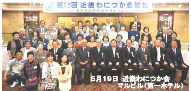
5月19日 近畿わかにつか会 マルビル(第一ホテル)