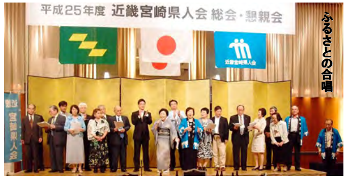
平成25年度 近畿宮崎県人会 総会・懇親会