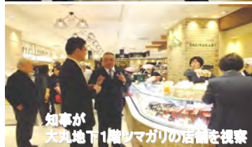
知事が大丸地下1階ツマガリの店舗を視察

2月2日、宮崎県・みやざきアピール課主催による「みやざき大使・応援隊交流会」が開催されました。