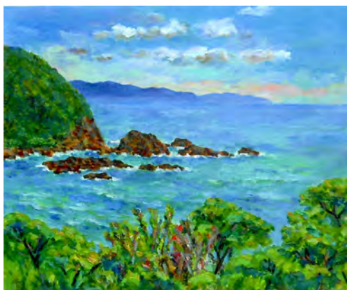
かしの浜(延岡市)より日向灘を望む(油彩10号)