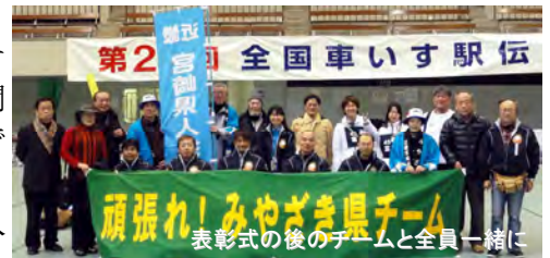
表彰式後のチームと全員一緒に

宮崎県チームは1時間15分51秒で21位でした。昨年は8位入賞で今年はさらに上位を期待しましたが、選手2人が入れ替わり、うまく行かなかったようです。