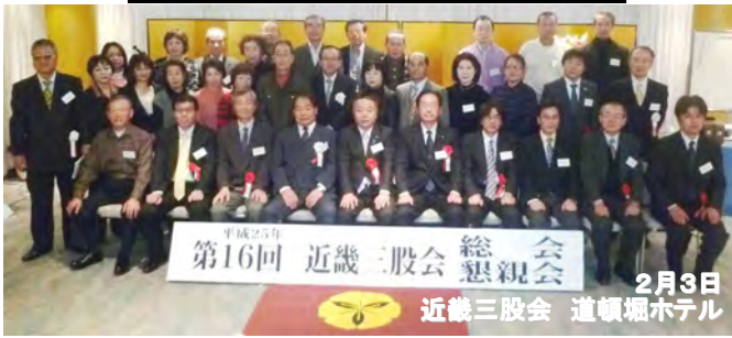
平成25年 第16回 近畿三股会 総会・懇親会 2月3日 近畿三股会 道頓堀ホテル