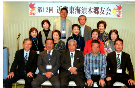
11月16日 近畿東海須木郷友会 道頓堀ホテル