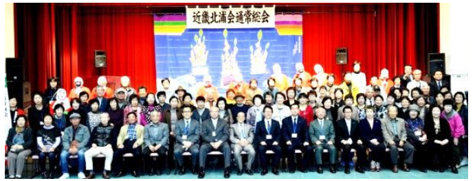
11月9日 近畿北浦会 港区民センター