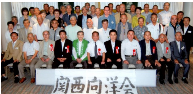
7月27日 関西向洋会(延岡工業高校同窓会) 道頓堀ホテル