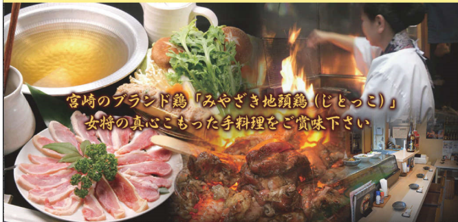
宮崎のブランド鶏「みやざき地頭鶏(じとっこ)」 女将の真心こもった手料理をご賞味下さい