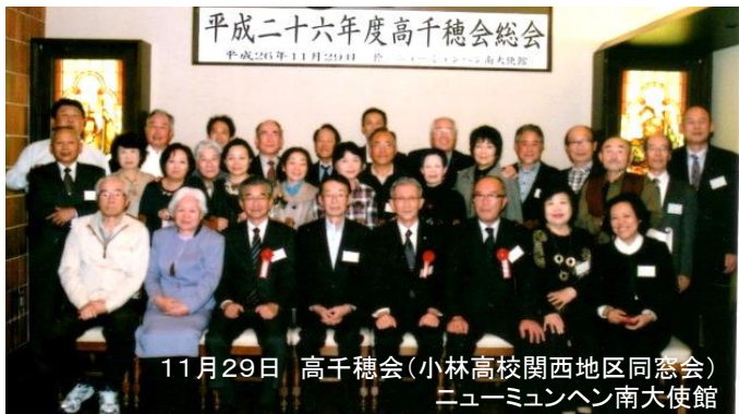
11月29日 高千穂会(小林高校関西地区同窓会) ニューミュンヘン南大使館