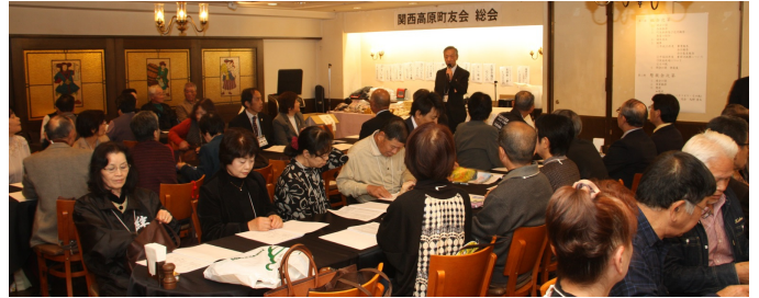
11月9日 関西高原町友会 アサヒアケラーアベノ