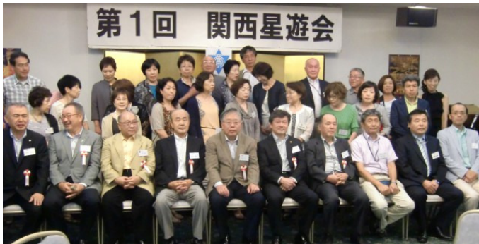
7月12日 関西星遊会(延岡西高校同窓会) 大阪弥生会館