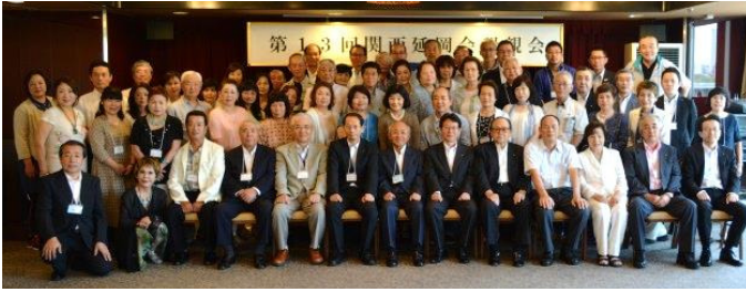
7月26日 関西延岡会 大阪キャッスルホテル