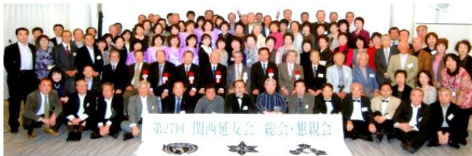
10月18日 関西延友会(延岡高校同窓会関西支部) 道頓堀ホテル