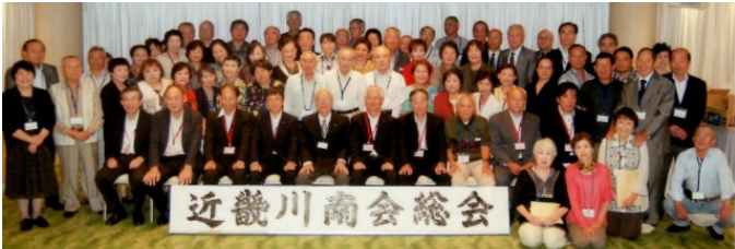
9月28日 近畿川南会 道頓堀ホテル