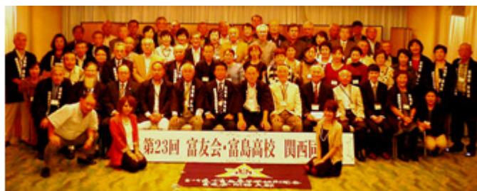
H26年度総会・懇親会

高校の精神的支柱とし、また生徒諸君の生涯を設計する指針として生かされたいとして制定された。