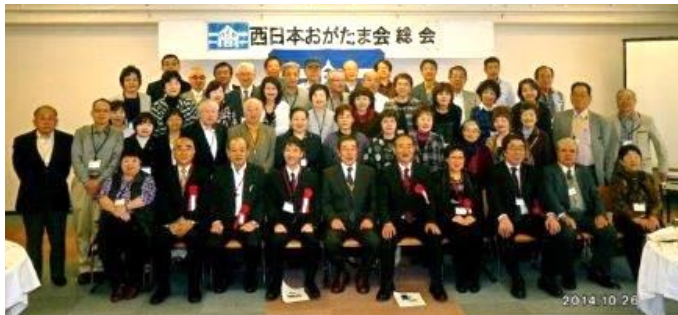
10月26日 西日本おがたま会(高千穂高校) 大阪リバーサイドホテル