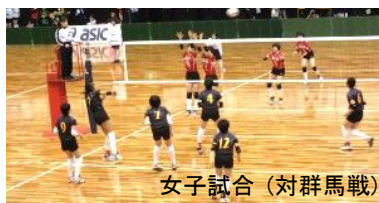
女子試合 (対群馬戦)

一方女子は群馬及び石川に1勝1敗の3セット目で負けて2連敗し予選3位となり、宮崎チームは男女とも決勝トーナメントに進むことができませんでした。