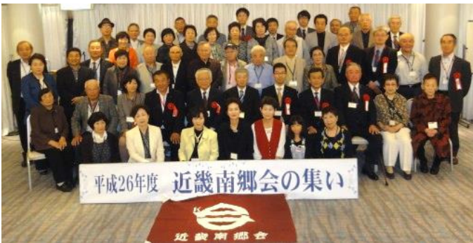
10月19日 近畿南郷会 道頓堀ホテル