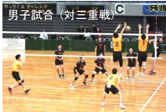
男子試合 (対三重戦)

先ず予選は3チームのリーグ戦で1位及び2位のチームがトーナメント戦に挑みますが宮崎県チームの男子は新潟県、三重県との予選で3組とも1勝1敗でしたが、試合内容により新潟、三重が勝ち上がり、宮崎チームは予選3位となり決勝トーナメントに出場できませんでした。