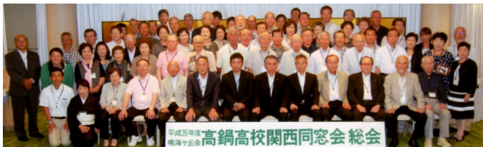
7月19日 高鍋高校関西同窓会 道頓堀ホテル