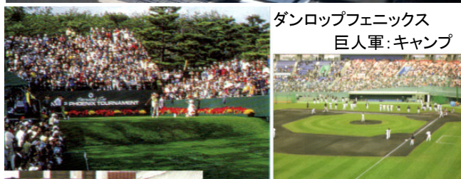
ダンロップフェニックス 巨人軍:キャンプ