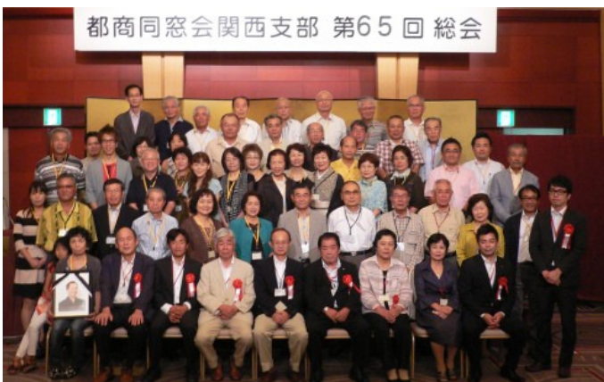
9月7日 都商同窓会関西支部(都城商業高校) ホテル阪神