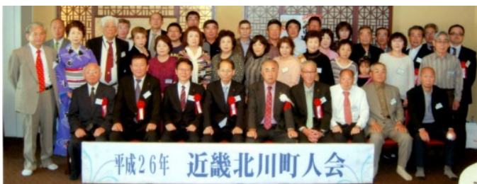
10月26日 近畿北川町人会 道頓堀ホテル