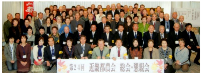
11月9日 近畿都農会 道頓堀ホテル