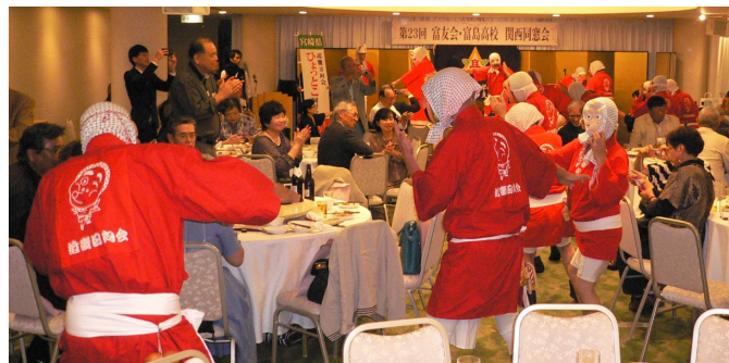
アトラクション: ひよっとこ踊り

3. 富島高校関西同窓会は昭和47.3.25に設立第1回を開催し、第3回までで一時中断していたが、平成2.3.25に再開後は2~3年ごと開催し、平成9.12.7の第6回以降毎年継続して総会・懇親会を開催してきている。平成25年からは9月第4週末の土曜日; 場所も道頓堀ホテルでと決めて、母校の校長先生や本部の同窓会(富友会)会長等をお招きして開催しております。同窓会の運営は、会員ばかりの懇親に限定せず、関連知人、友人等誰でも参加OKで、楽しい時間を過ごせるように構成して運営しておりますので気楽に参加してください。