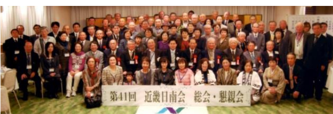
11月2日 近畿日南会 道頓堀ホテル