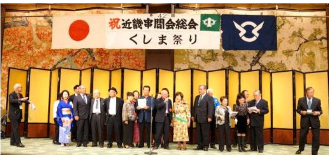
10月19日 近畿申間会 リーガロイヤルホテル