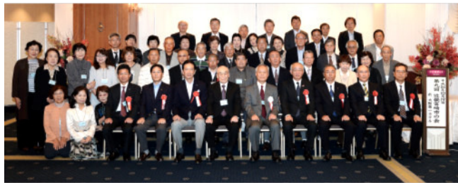
平成26年度総会・懇親会(大阪駅前第一ホテル)

さらに平成22年には隣接の清武町との合併で人口約40万人の『新都市・宮崎市』が誕生しました。