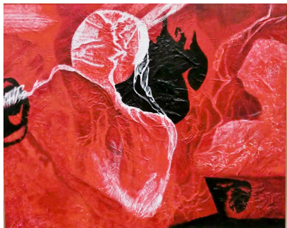
● 作者：大倉頼子 (西白杵郡五ヶ瀬町出身・日本現代美術協会 会員) ● 作品：平成 26 年度「日現展」入賞作品・「大阪府教育委員会賞」 『異次元の妖しい曼珠沙華』