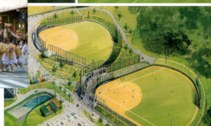
オリックスキャンプ地:清武運動公園

さどはら春の特産祭り 宮崎ストリート音楽祭 宮崎納涼花火大会 福岡ホークスキャンプ 高岡月知梅うめまつり