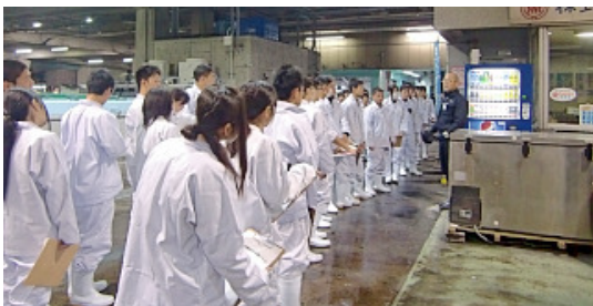
水産流通校外学習