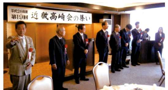
11月16日 近畿高崎会 大阪キャッスルホテル